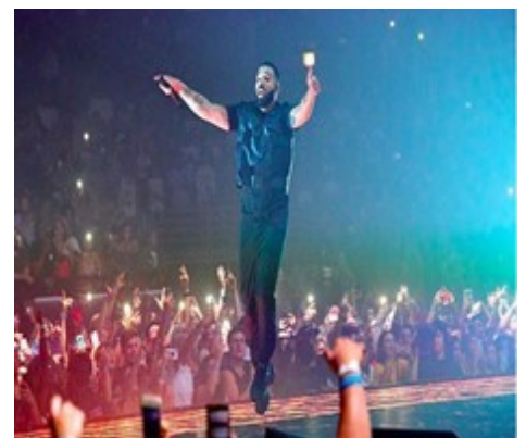
Drake en concert à l'Accorhotel Arena à Paris, en mars 2017