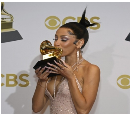
Doja Cat lors des Grammy Awards 2022, le 3 avril dernier à Las Vegas

Amicalement, signé votre rédactrice préférée : Lilou Carrere